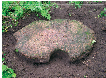
Kamień młyński w Zegrzynie