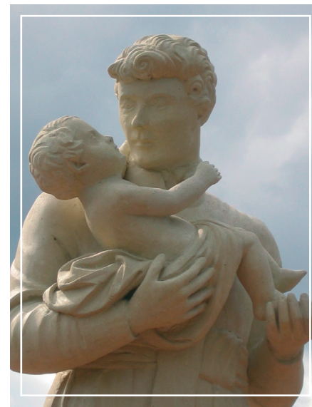
Figura św. Stanisław Kostki w Jadwisinie.

3. Ruiny młyna parowego >> Po przejściu zaledwie kilkudziesięciu metrów leśną ścieżką wiodącą w kierunku Zegrza, znajdujemy dobrze ukryte wśród drzew ruiny młyna parowego – fundamenty i kamienne koła młyńskie. Młyn został wybudowany w latach 1858-1860 przez firmę „Aleksander Łapiński i spółka”, dając początek „osadzie fabrycznej”. Nowatorska, czteropiętrowa murowana budowla, wyposażona w silną maszynę parową, była wówczas jedną z trzech tego typu konstrukcji w Europie. Zboże transportowano Narwią. W tym celu wybudowano przystań dla statków i barek. W 1880 r. młyn sprzedano „Zakładom Przemysłowo-Zbożowym