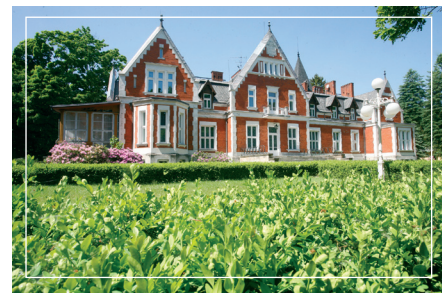
Pałac Radziwiłłów w Jadwisinie